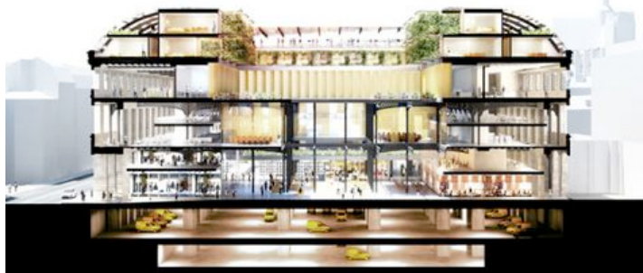
Le projet de la poste du Louvre, à Paris. - DPA/ADAGP

Entre les opérations de réaménagements et les futurs réalisations, visite dans l'atelier de l'architecte.